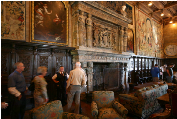
Delar av salongen med antika vävnader på väggarna

Kontrasten blev enorm när vi en timma senare svängde in vid Hearst Castle. Mediamagnaten William Randolph Hearst hade under sin uppväxt inspirerats av Europas många slott och herresäten och lät vid San Simeon, högt ovanför byn med vidsträckt utsikt över de omgivande kullarna och havet, bygga sitt drömslott på familjens egendom. Självt kallade han det för "ranchen". Under 28 år hade han hjälp av arkitekten Julia Morgan både med byggnationen och med inredningen, som kommer från både slott och kloster i Europa. Idag skulle man aldrig fått föra ut dessa skatter men på den tiden kunde pengar lösa det mesta. Det var ingen lätt uppgift att vara arkitekt då planerna ständigt ändrades och vissa delar fick byggas om flera gånger innan Hearst var nöjd. Härifrån drev Hearst sitt mäktiga tidningsimperium och här hölls överdådiga fester med dåtidens stjärnor.