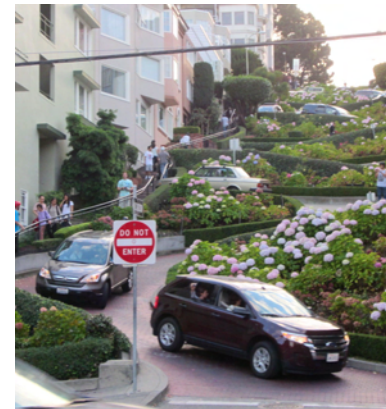
Kurvorna vid Lombard Street

Vi kikade på de branta kuperade gatorna, strosade vid Fishermans Wharf, fick en glimt av Golden Gate-bron, tittade på de gamla kabeldragna spårvagnarna och gick upp för Lombard Street, stadens mest fotograferade gata. Känd som världens krokigaste gata med sina 8 hårnålskurvor! På grund av sin branta lutning byggdes en sträcka av gatan om på 1920-talet som då fick sina kurvor och den karakteristiska röda beläggningen med planteringar på sidorna. Här står hela tiden turister med kameran beredd! Ändå är detta inte den brantaste gatan. Filbert Street, bara 2 gator bort, är världens brantaste gata med lutning på 31,5 grader på en längre sträcka och är den som varit med i många filmade biljakter. Kuperat med branta gator är det nästan överallt, en del av stadens charm.