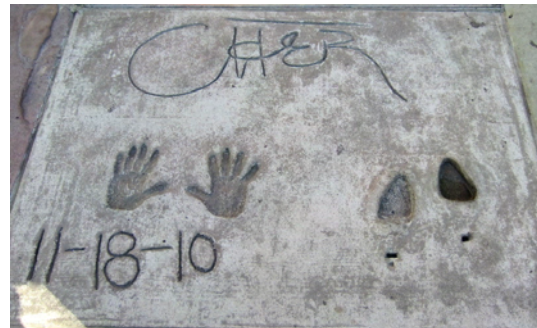
Hand- och fotavtryck utanför Graumans, här Cher's

Utanför biografen finns hand- och fotavtryck från många av de stjärnor som setts på duken. Först ut var Mary Pickford och Douglas Fairbanks, då Pickford av misstag gick i våt cement. Sedan dess är det en tradition och urvalet av kändisar gjordes av Sid själv så länge han levde men görs idag enligt ett hemligt system. Det var också Grauman som startade med att rulla ut röda mattan för kändisarna som anlände till hans salong.