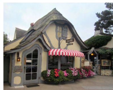
Ett av de söta husen i sagostaden Carmel

På morgonen körde vi ner till havet och i Carmel är det gratis att köra i villaområdet. Kanske inte lika flotta villor som vid 17 Mile Drive och inga golfbanor men oj, så mysigt. Fina, söta, läckra hus, de flesta i högst vanlig storlek men prydligt, udda och lekfullt.