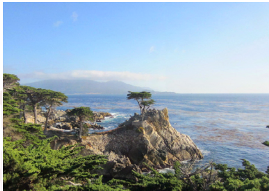
Vindpinad ceder - 250 år gammal!