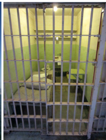
Och en av cellerna

Själva tog vi båten tillbaka och besökte sedan Pier 39. Denna är idag omgjord till köpcenter med många udda, lustiga butiker och massor av restauranger. Och tillhåll för sjölejon! Sedan 21 år finns en stor flock sjölejon här, solandes på plattformar inne i hamnområdet.