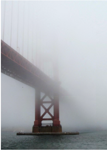
Inte mycket bro denna dag!

Sen gick färden genom vackra Golden Gate Park, via stadsdelen Sunset och åter längs kusten vid Pacific Ocean. Fortfarande i dimma så det enda vi såg var resterna av de vågor som rullade in. Genom Presidio, den stora parken vid Golden Gate-bron och ut till Fort Point, utsiktsplatsen vid brofästet. På bilder sticker bron ofta upp ur dimman men här gick den ner ur densamma!