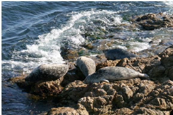
Sälar vid Pacific Grove

Längs kustvägen, Highway 1, förstås. Vi stannade här och där och tog lite bilder, lunchade och njöt av att se havet. Hela Pacific Ocean ligger utanför. När vi passerat Monterey och dess skyddade bukt svängde vi av från Highway 1 och körde ut till Pacific Grove. Härifrån kunde vi sedan köra "17 Mile Drive" tillbaka. En privat betaltväg som går genom ett exklusivt bostadsområde omgivet av tre golfbanor med olika karaktär och med närhet till havet. Vi stornjöt, havet på västkusten var sig likt med granitklippor, saltstänk, tångdoft och ett evigt brusande. Här såg vi både säl och sjölejon. En hel del fåglar men också en massa vindpinade träd, främst pinje och cederträd.