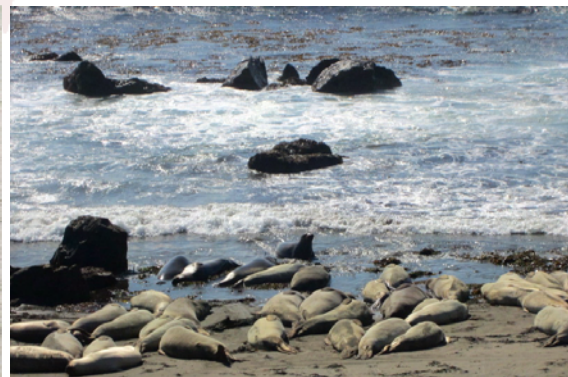
Stora flockar låg på stranden och solade