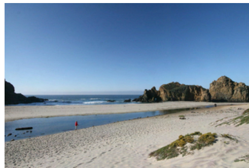
Läckra Pfeiffer Beach

Titta här! Och titta där! Synintrycken blev många och efter någon timma svängde vi av in på en smal slingrande väg ner mot en strand. Vi besökte Pfeiffers Beach, som påstås vara den vackraste längs sträckan men svår att hitta. Med GPS är det inga problem. Den smala skogsvägen ner kantades av mäktiga redwood-träd. Väl nere på stranden hade vi tur för vi kom dit då vattnet var lågt, men stigande. Vattnet slog mot de vassa formationerna så skummet yrde. Längst in på stranden hade det bildats en sötvattenpool från bergen bakom.