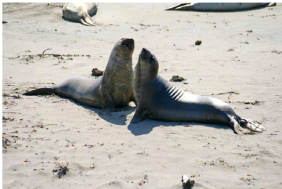
Unghannarna testar sina krafter på varandra

Väldigt speciella djur som man trodde var utrotade innan man hittade ett hundratal djur på en mexikansk ö. Dessa fridlystes och på 1930-talet kom de första till Kalifornien. Nu finns här en koloni om ca 15 000 djur och vi fascinerades förstas. Denna tid på året är det bara honor och ungdjur här så de hannar vi såg var tonåringar som testade sina krafter på varandra. Det är bara vuxna hannar som har den karaktäristiska snabbliknande nosen.