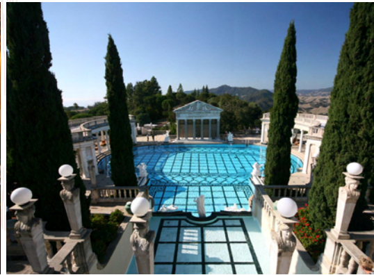
Neptuns Pool, överdådigt påkostad

Vi fortsatte sedan en bit längs kusten och svängde in på Highway 101 som går parallellt med 1:an men är betydligt snabbare. Målet för dagen var Solvang, den lilla byn som är det danskaste man kan hitta utanför Danmark. Korsvirkeshus, väderkvarnar och bagerier.