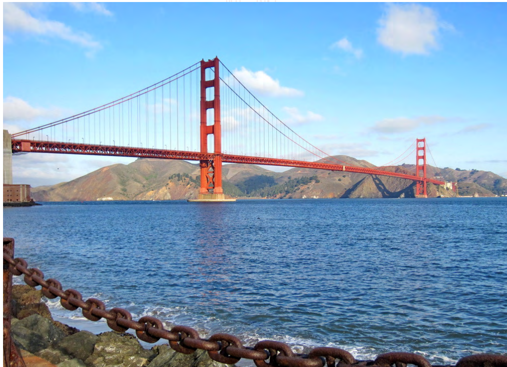
Golden Gate-bron i San Francisco en klar dag